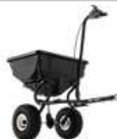
954 12 00-46 Spridare 30

Bogserad spridare med enkel justering av flöde, för större områden. Sluten kommersiell växellåda för jämna drivning och enkelt underhåll och stora däck för enkel manövrering. Slitstarkt nylonskydd inkluderat. Kan användas för att sprida gödning och frön i din trädgård samt för issmältning under vintern. Om spridaren används med salt, se till att rengöra spridartratt och rör efter användning för att förhindra korrosion