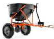
967 02 72-01 Spridare 75

En spridare av hög kvalitet för professionell användning. En elektriskt manövrerad spridare som garanterar jämn spridning. Skyddsgallret överst kan också användas som en skiljevägg när man använder gödningsmedel, salt, sand eller fint grus med en storlek upp till 30 mm. När spridaren används för vinterbruk skall ridern förses med hjulvikter och snökedjor. Av säkerhetsskäl bör inte spridaren användas vid lutning mer än 10 grader åt något håll.