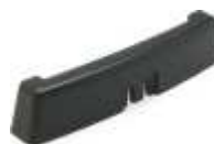
953 53 49-01 Motvikt 16 kg. För ett bättre grepp och säkrare körning.