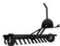
953 51 24-01 Grusharv

Mossrivare för användning med fästanordning (586 63 72-01). Rensar lätt bort mossan för en friskare gräsmatta. De fjädrande pinnarna är värmebehandlade för att bli extra hållbara.